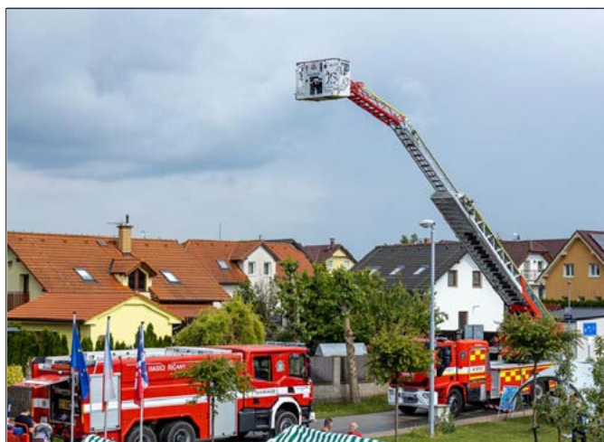
Na oslavu přijeli i hasiči z Karlovarského kraje a Modletic

Velkou pozornost vzbudily ukázky zásahů hasičů