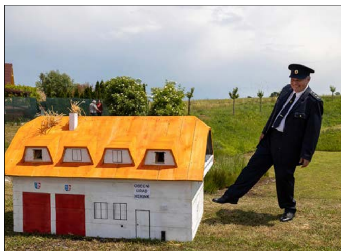
Pro jednu z ukázek využili hasiči maketu obecního úřadu