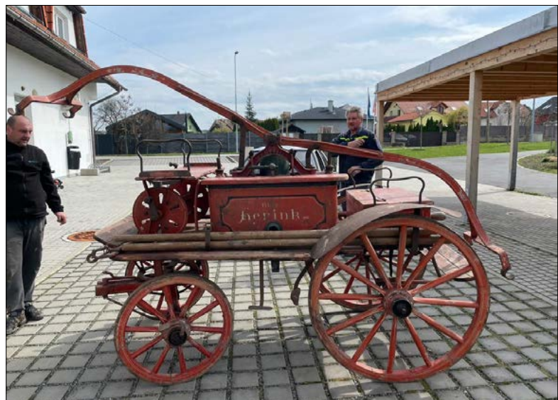
Historická stříkačka SDH Herink z roku 1890