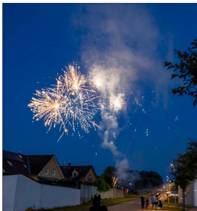
Oslavy vyvrcholily ohňostrojem