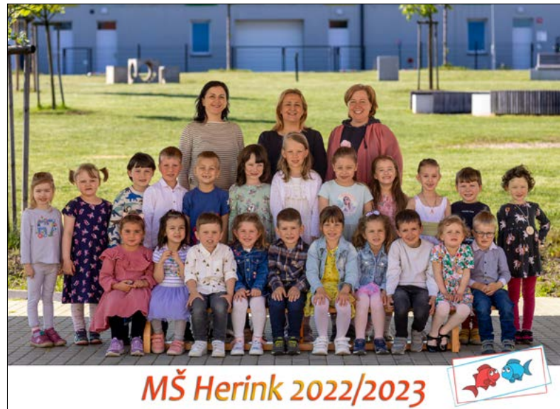
MŠ Herink 2022/2023