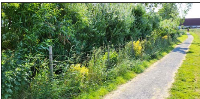
Jeden z příkladů neoprávněného užívání obecního pozemku.

K erozi půdy a v důsledku toho i k poškození cesty došlo loni v srpnu po vydatných deštích. Velmi si v této souvislosti ceníme přístupu společnosti Agro Jesenice. Přestože k problému pravděpodobně nedošlo její vinou, tedy smyvem půdy z pozemků, které v sousedství cesty obhospodařuje, nabídla obci, že cestu na vlastní náklady opraví. Učiní tak částečným odbagrováním stečené zeminy, dosypáním původní cesty obrusem a jejím zpevněním. Podél cesty pak vysadí travní porost v šíři osm metrů. Hotovo by to mělo být do poloviny července.