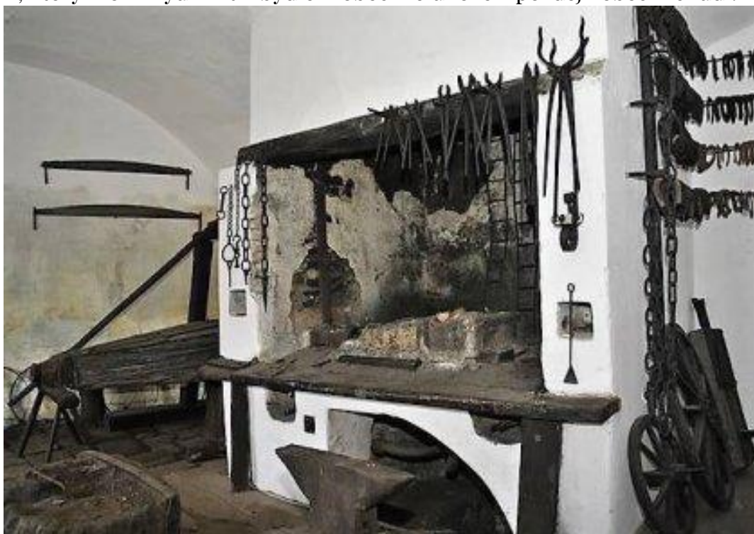
Interiér kovárny - ilustrační foto

Než byla vystavěna kovárna obecní, sídlil kovář v čp. 8 a zde stála obecní pastouška - dům, který mohli využívat k bydlení obecní sluhové a později obecní chudí.