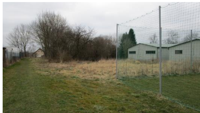
Školka ještě chybí