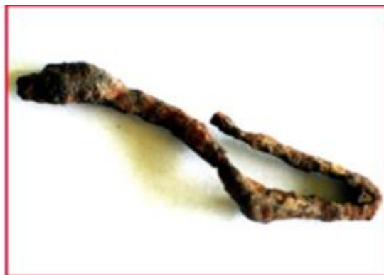
Herink 1. Část středolaténské železné spony spojené konstrukce

Větší část osady už sice leží na katastru Osnice, ale přesto ji můžeme považovat taky trochu za svou. Celkem se zde nacházelo 173 objektů - polozemnic, zásobních jam i nadzemních kůlových staveb a pecí. Stáří této osady určili archeologové podle střepů keramiky a podle zlomku železné spony do mladší doby železné.