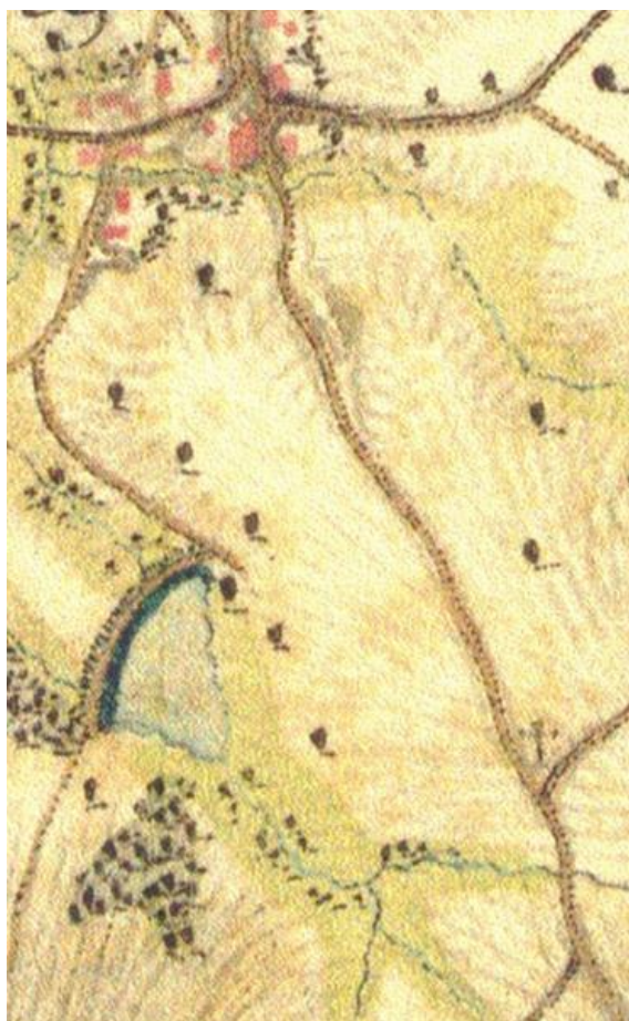
Rybník v r. 1769

Hráz byla patrná ještě v polovině minulého století, materiál z ní se ale použil na zpevnění polních cest a tak postupně zanikla úplně..