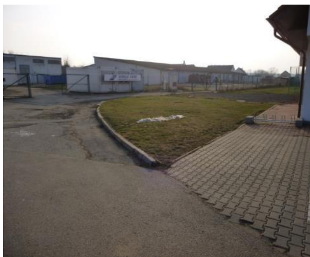
Vpravo vykukuje obecní úřad s krámkem

Další série fotografií je z r. 2015, kdy už stojí nový úřad, fotbalové hřiště, ale také tu ještě jsou hospodářské budovy bývalého JZD a samozřejmě chybí školka.