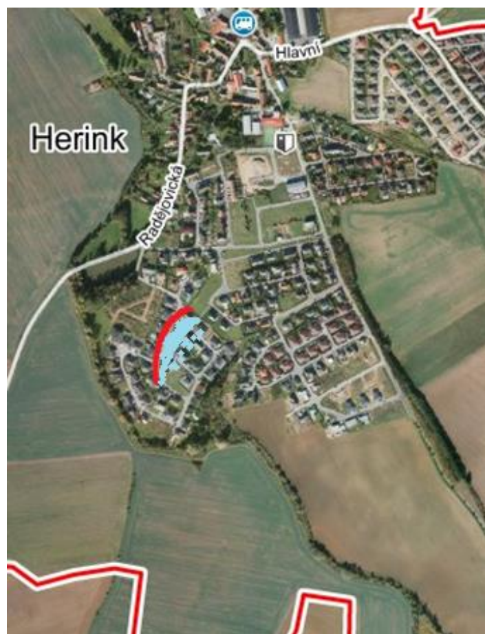
Stejně místo dnes