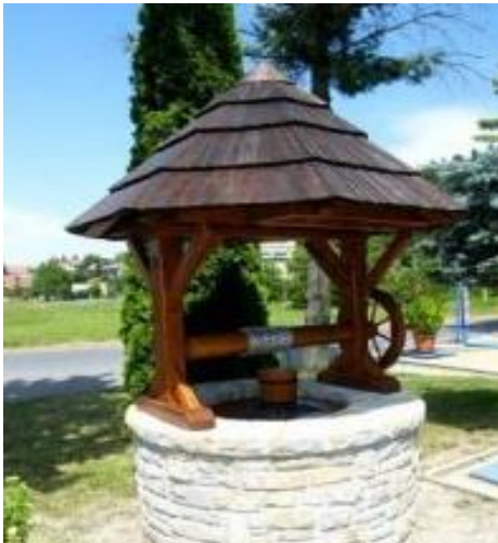
Studna s rumpálem

už není funkční. Studna byla léta pravidelně udržována a opravována a sloužila až do r. 1964, kdy zničila vodu ve studni močůvka z JZD.