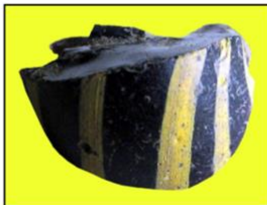
Herink 1. Fragment dvoubarevného skleněného korálu z doby laténské