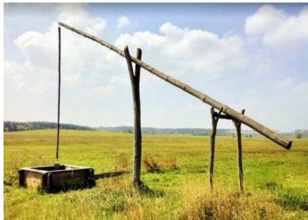
Studna s vahadlem

Na náves navazoval ještě další veřejný prostor, dnes v ulici U kovárny - předzahrádka před č.p. 2 byla podstatně menší a ulice byla až k odbočce ke statku č.p. 1 tak prostorná, že se jí říkalo „dolní náves“.