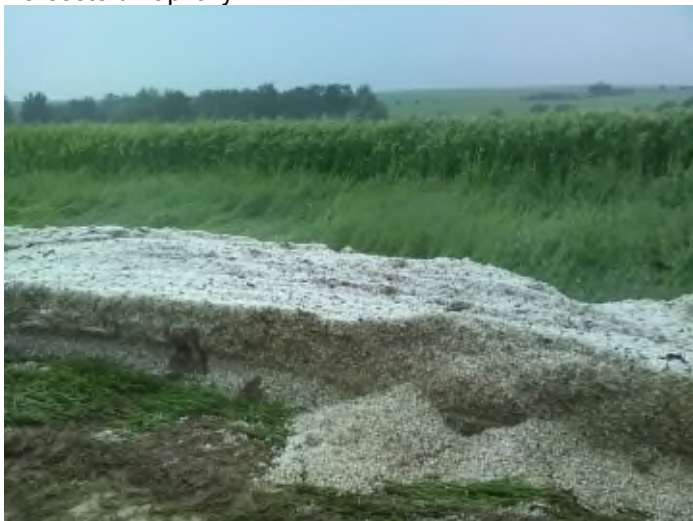
Na cestě u kapličky

2. 6. zasáhl Herink vydatný déšť s krupobitím, blesková povodeň se prohnala od kapličky ulicí Do Višňovky až k obecnímu úřadu. Zde byly následky promptně zlikvidovány jednotkou SDH Herink. Jednalo se zejména o likvidaci naplaveného bahna a zprůjezdnění zmíněné ulice.