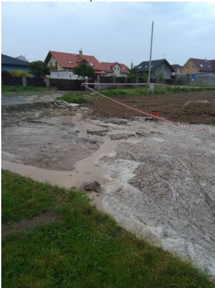
Pohled od hasičské zbrojnice